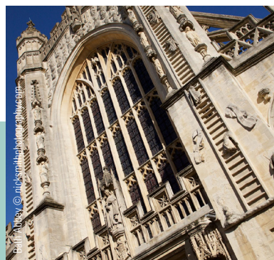
Bath Abbey