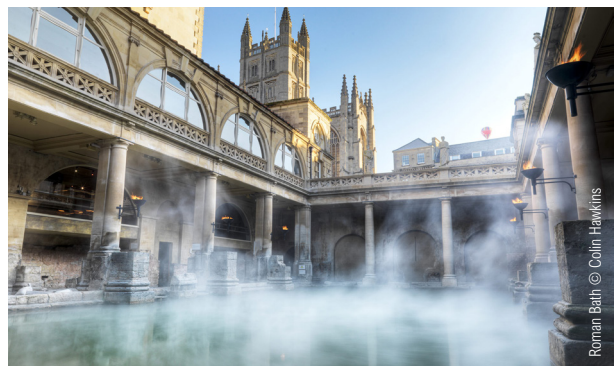
Roman Bath