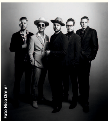
The Bluesanovas 12.04.2025