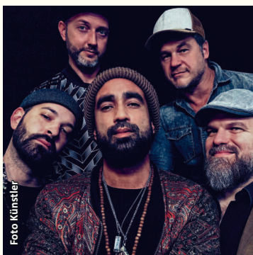
Marleys Ghost 01.03.2025